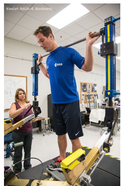
↑ ESA-astronaut Thomas Pesquet tijdens een trainingssessie.

Locatie: stroeve ondergrond zoals een gymzaal, buiten in droog gras of een atletiekbaan